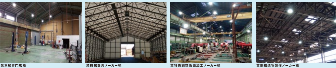
某車検専門店様 某機械器具メーカー様 某特殊鋼板販売加工メーカー様 某鋼構造物製作メーカー様